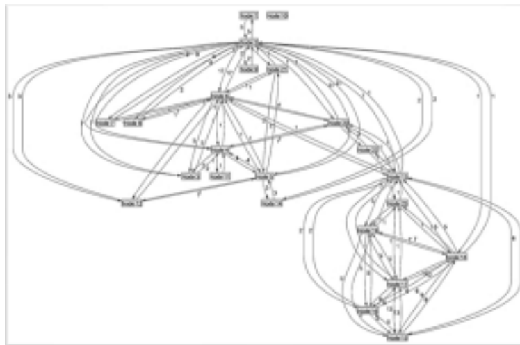
(شکل-۳): نمونه شبکه Lesmis به دست آمده با استفاده از روش نمونه‌گیری پیشنهادی (Figure-3): The obtained sample from Lesmis Social Network using proposed sampling algorithm

درجه بر حسب مقدار KS ، و پارامترهای \alpha و X_{min} ، روش پیشنهادی کارایی بالای نمونه‌گیری را نسبت به روش‌های بر روی مجموعه داده‌های مختلفی از لحاظ معیار خطای نسبی نشان داد. در سایر معیارها مانند حفظ ضریب خوشه‌بندی و ساختارهای انجمنی در نمونه حاصل نیز نتایج به دست آمده در جداول (۸ تا ۱۱) نشان داد که روش پیشنهادی به دلیل اهمیت دادن به گره‌های کلیدی مثل گره‌های هسته و هاب تا حد زیادی مانع از بهم خوردن توپولوژی شبکه می‌شود و به طبع آن تعداد انجمن‌ها و ضریب خوشه‌بندی شبکه اصلی و شبکه نمونه برداری شده مشابهت بالایی را در روش پیشنهادی نشان می‌دهد.