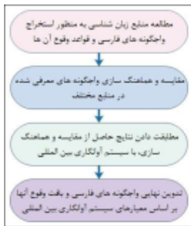
(شکل-۱): مراحل استخراج واج‌گونه‌های زبان فارسی (Figure-1): Steps for extraction of Persian allophones

خیشومی" ۲ و "رهش کناری" ۳ در نظر گرفته شده است. در ادامه و در تعیین واج‌گونه‌های نهایی مختص هر واج، واج‌گونه‌ای به‌نام "سایر" در نظر گرفته شده است و هر یک از واج‌ها در بافتی به‌جز بافت‌های واج‌گونه‌ای مشخص شده برای آن‌ها، در این دسته قرار گرفته‌اند و علامت پایه هر واج به آن‌ها اختصاص یافته است. از معرفی واج‌گونه‌هایی که تعریف شرایط وقوع آن‌ها نیازمند امکاناتی فراتر از امکانات فعلی پژوهش بوده، صرف‌نظر شده است تا این واج‌گونه‌ها نیز در دسته سایر قرار گیرند؛ به‌عنوان مثال، با توجه به امکانات فعلی دادگان مورد استفاده (دادگان گفتاری زبان فارسی یا همان فارس‌دات کوچک)، تشخیص هجاهای تکیه‌دار نبوده است؛ بنابراین بافت‌هایی که بر اساس هجاهای تکیه‌دار تعریف می‌شده‌اند، نادیده گرفته شده و واج‌گونه‌های مربوط به آن‌ها، در دسته سایر قرار گرفته‌اند. واج‌گونه‌هایی که برای آن‌ها معادلی در جداول IPA یافت نشده و نیز بافت‌های مربوط به آن‌ها از فهرست اولیه واج‌گونه‌ها حذف شده‌اند و مصادیق آن‌ها در صورت عدم تطابق با دسته‌های واج‌گونه‌ای موجود، در دسته سایر قرار گرفته‌اند. روند استخراج واج‌گونه‌های فارسی، در شکل (۱) نمایش داده شده است.